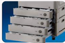
Acceso al papel mediante un botón