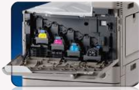
Fácil acceso al tóner