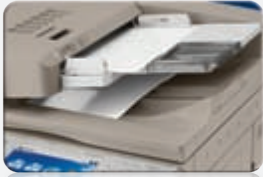
Luz en el ADF