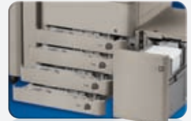
Acceso al papel mediante un botón