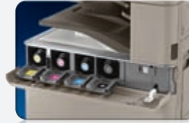
Fácil acceso al tóner