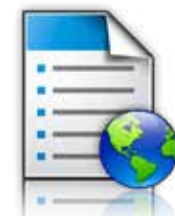
Formularios y Favoritos