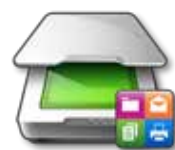
Centro de digitalización