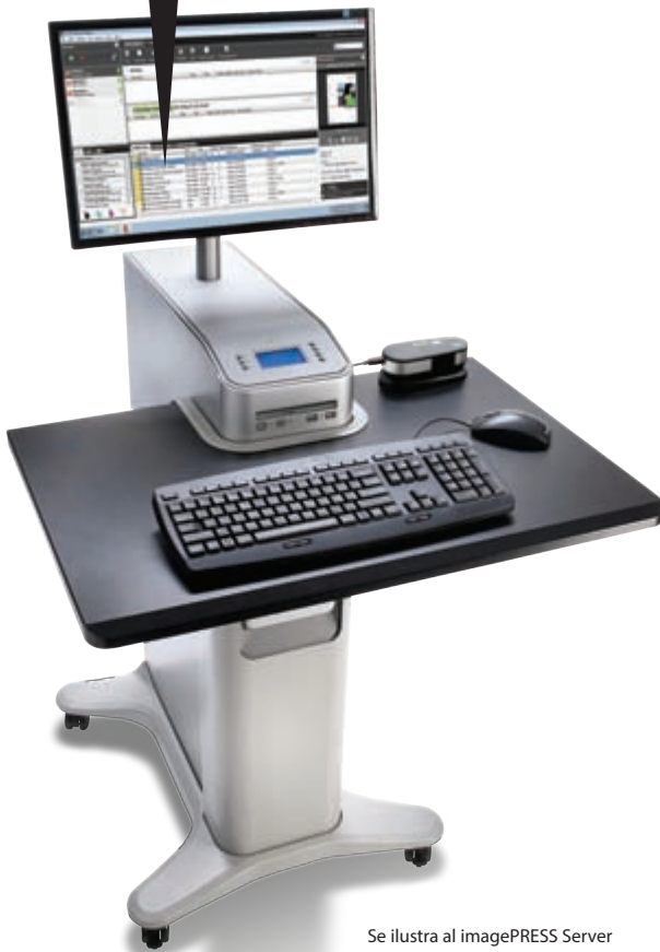
Se ilustra al imagePRESS Server B5000 con sus opciones.

Procesa simultáneamente uno o varios trabajos a través de hasta cuatro RIP.